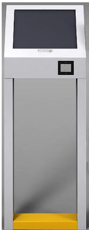
Dialog objednávacího boxu