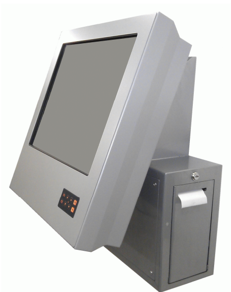
Box TSD Wall Touch s možností tisku náhradních stravenek