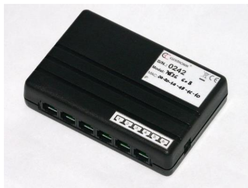
Převodník - HUB PE26-6x8