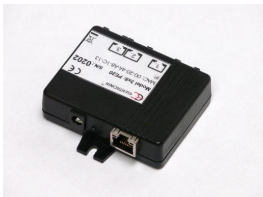
Převodník - HUB PE20-3x8

Ve variantě Eth. / RS485 (PExx) je HUB osazen převodníkem umožňujícím komunikaci prostřednictvím sítě LAN, případně internetu či sítě VPN.