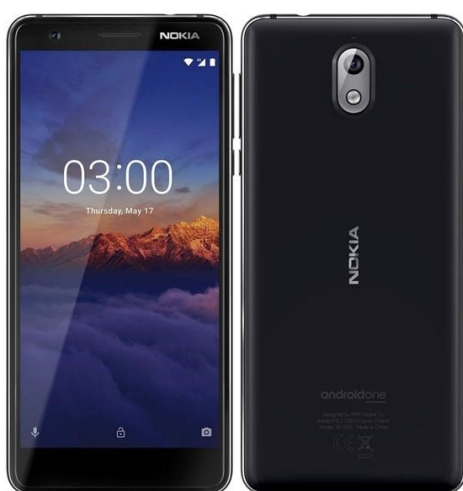
Výdejní terminál EKO