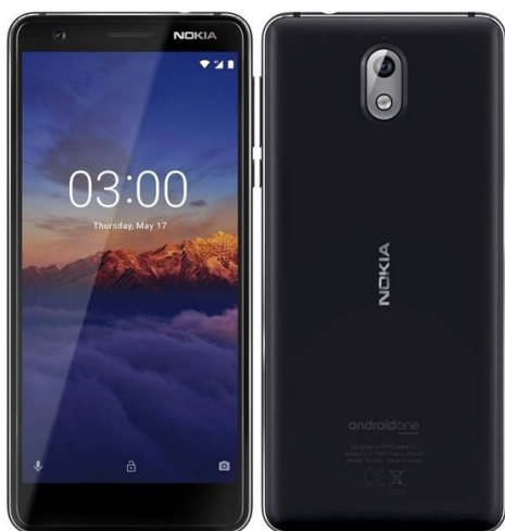
Výdejní terminál EKO