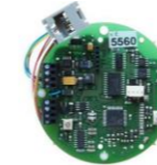
Otvírač dveří plus TR 50