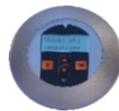
Docházkový terminál AC (TD50)