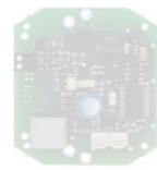
Otvírač dveří TR 42