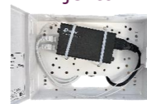
Instalační skříň-PoE Injektor