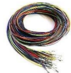
propojovací kabeláž RS485