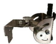
Držák UNI OKW pro TS/I/C3x